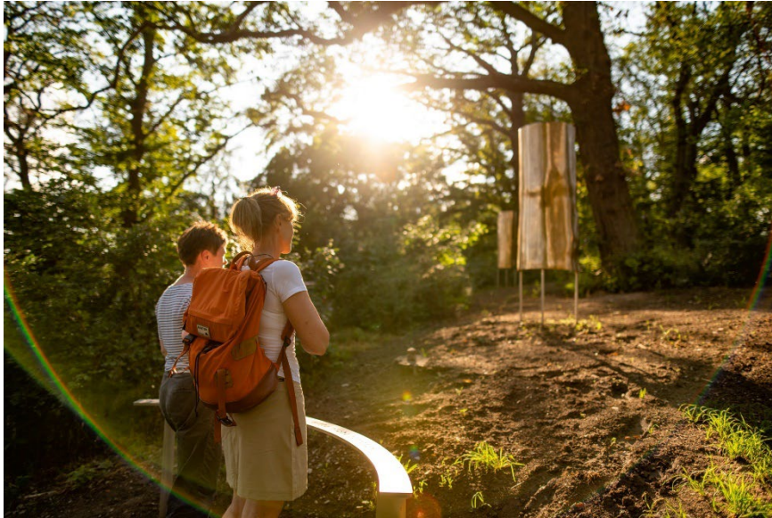
Abbildung 1: WÄCHTER – José Cobo Calderón.