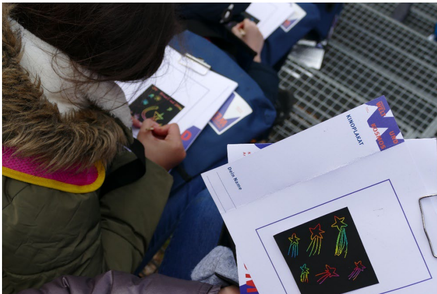
Abbildung 2: Entlang des Weges entstehen kleine Kunstwerke.