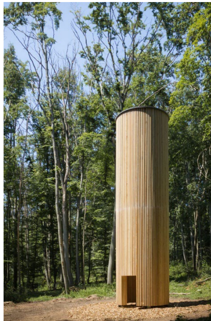
Abbildung 4 und 5: WALDPAVILLON – Hayato Mizutani.