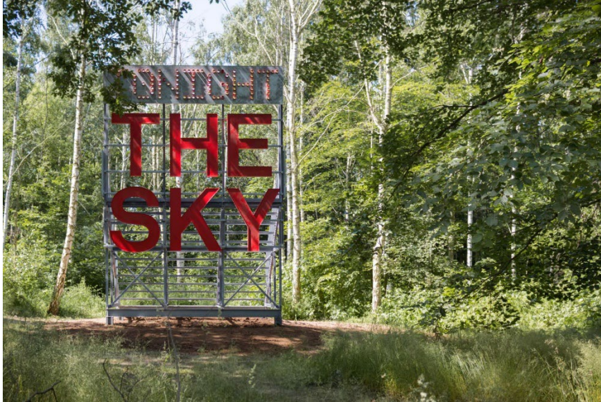
Abbildung 3: TONIGHT – THE SKY – Michael Krenz.